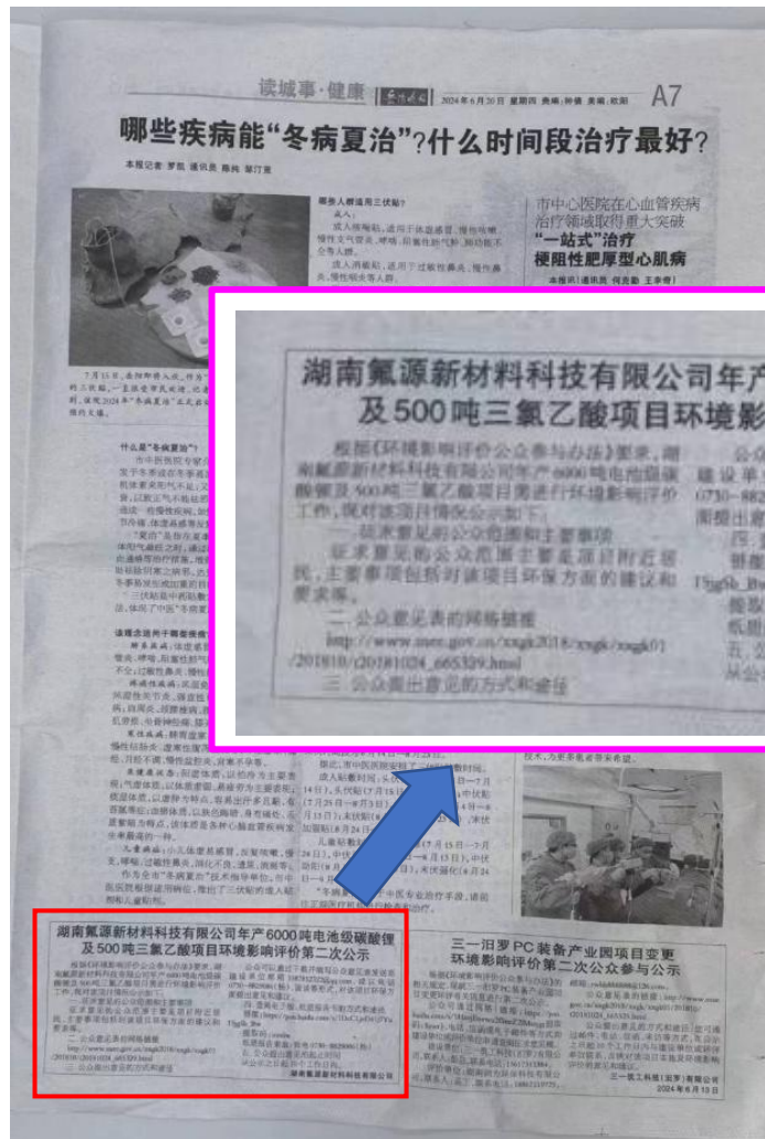
图4 第二次报纸公示