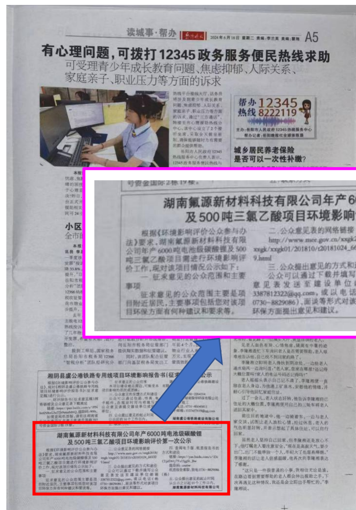
图3 第一次报纸公示